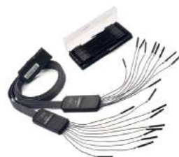
*T3DSO2000HD-MS には MSO オプションが標準装備