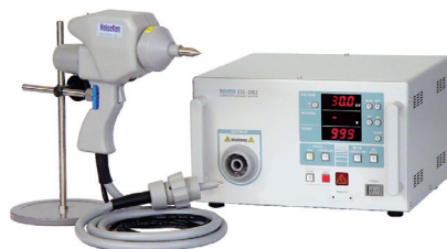
ESS-2001 / 2002