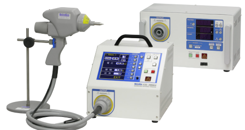
ESS-2000AX / 2002EX

修理対応が終了している静電気試験器および放電ガンをお持ちのお客さまは、後継器(現行機種)への買換えのご検討をお願いします。 後継器(現行機種)については裏ページをご覧ください。