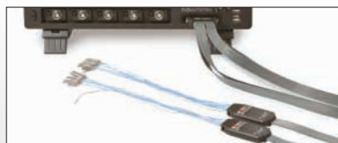
16本のデジタル・チャンネル (HD06000B-MSシリーズ)