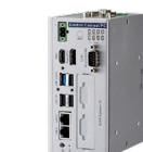
WebAccess/SCADA UNO-1372 IPC Windows10IoT SSD:64GB RAM:4GB WebAccess300タグ