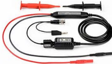
差動プローブ TA058 (50MHz)