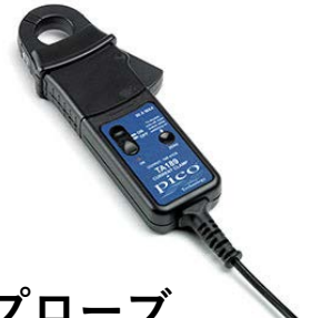
電流プローブ TA189 (30MHz)