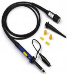
受動プローブ TA375 (100MHz)