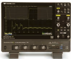
デジタル・オシロスコープ