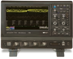
デジタル・オシロスコープ