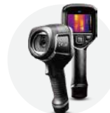
FLIR E6-XT ¥320,000(税抜)