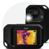
FLIR C2 ¥98,000(税抜)