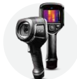
FLIR E8-XT ¥530,000(税抜)