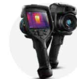
FLIR E53 ¥649,000(税抜)

本キャンペーンは対面販売でご購入のお客様が対象となります。(インターネットからの購入は対象外です)