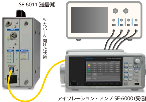
アイソレーション・アンプ SE-6000 (受信側)