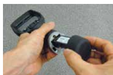
リプレーサブルバッテリー