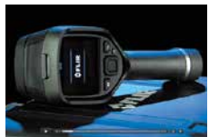
国内フルメンテナンス