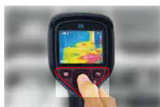
片手で全ての操作が可能