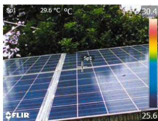
デジタルカメラモード

MSX ® 機能(スーパーファインコントラスト機能)は、リアルタイムで画像を補正することができ、構造物の詳細や発熱箇所の判別が熱画像上で容易に行えます。また、デジタルカメラモードとの同時撮影も可能で、同画角の可視画像を簡単に生成することができます。