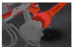
閾値設定機能 カラーアラーム機能